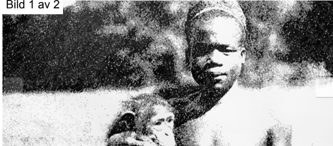
The First Pygmy Has Been Secured (2012). Blyertsteckning av EvaMarie Lindahl. Beskuren.